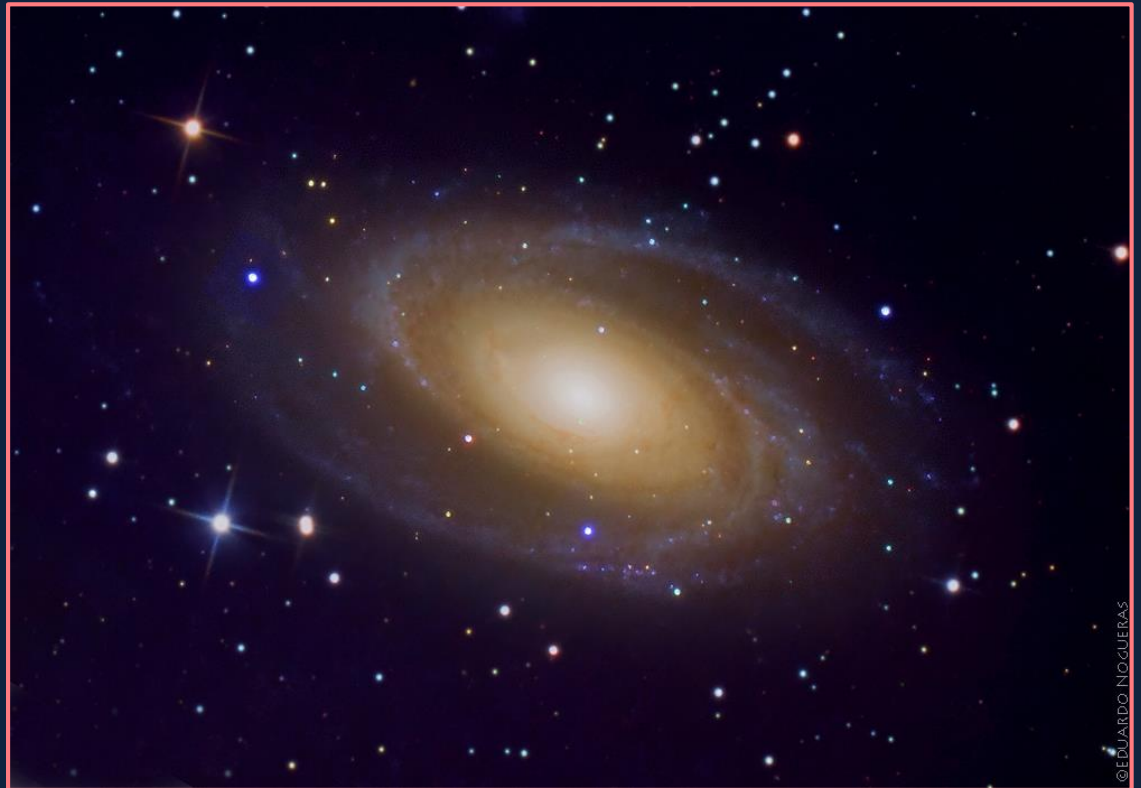
Galaxia del Bode fotografiada con telescopio

Esta ubicada a 12 millones de años luz de nosotros y destaca su brillante núcleo y sus nubes de gas y polvo de color naranja y azul. Se presume que la galaxia de Bode contiene aproximadamente 250.000 millones de estrellas, siendo ligeramente más pequeña que la Vía Láctea. La galaxia (M81 en el catálogo Messier) es uno de los mejores ejemplos del diseño espiral con brazos casi perfectos dispuestos en espiral hacia su centro.