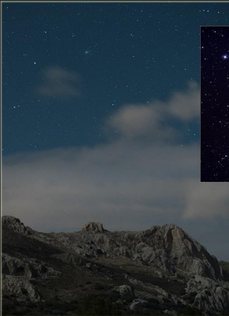
Cometa sobre el peñón de Majalijar (PN Sierra de Huetor)

Durante el mes de enero del 2023 he podido ir observando el paso de un cometa muy brillante durante la noche. Se trata del cometa c/2022 E3 (ZTF), popularmente conocido como el cometa verde. Se crearon expectativas de poder observarlo a simple vista, pero finalmente, yo al menos no fui capaz de verlo a simple vista, llegando a la magnitud 5 el 1 de febrero. C/2022 E3 (ZTF) es un cometa de período largo que fue descubierto por el proyecto Zwicky Transient Facility (de ahí lo de ZTF) el 2 de marzo de 2022 (Fuente: wikipedia) Esta fotografía muestra una visión paisajística del cometadurante el anochecer desde un bosque del PN Sierra de Huetor (Granada).