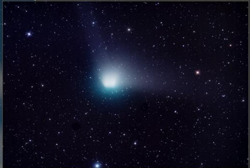
Cometa c/2022 E3 (ZTF) en su máximo acercamiento a la Tierra