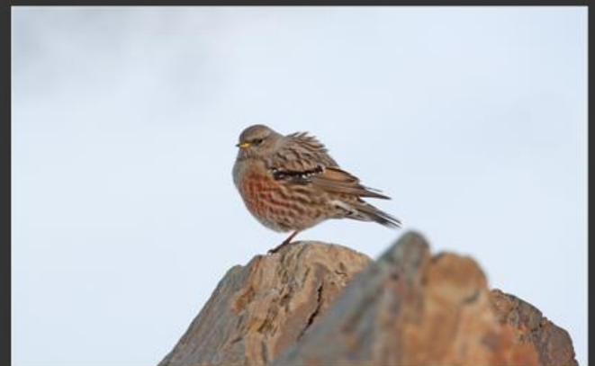
Acentor alpino ( Prunella collaris )

He podido observar este pajarillo con frecuencia revoloteando entre las piedras y la nieve de la alta montaña de Sierra Nevada. Aunque también lo he observado en el PN Sierra de Castril. Lo que me ha llamado más la atención es su capacidad de adaptación al clima y la meteorología adversa de la alta montaña. Una maravilla que espero pueda seguir disfrutando de sus vuelos y de su viveza a más de tres mil metros de altura.